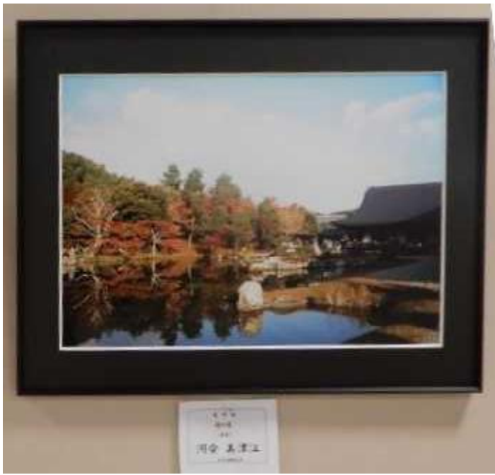
河合 美津江 1955年 10月