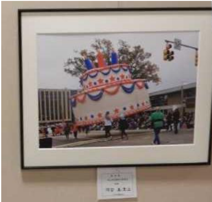
河合 美津江 1955年 10月