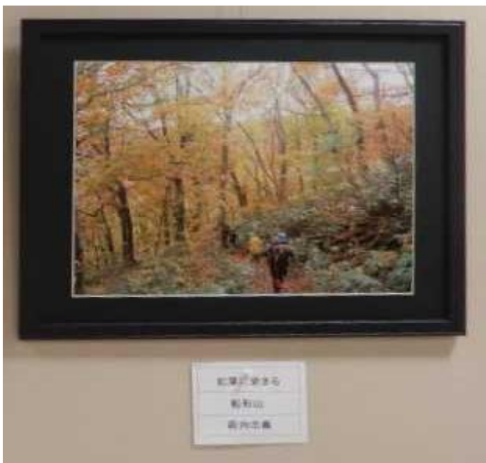
紅葉山 新山 李竹 園子