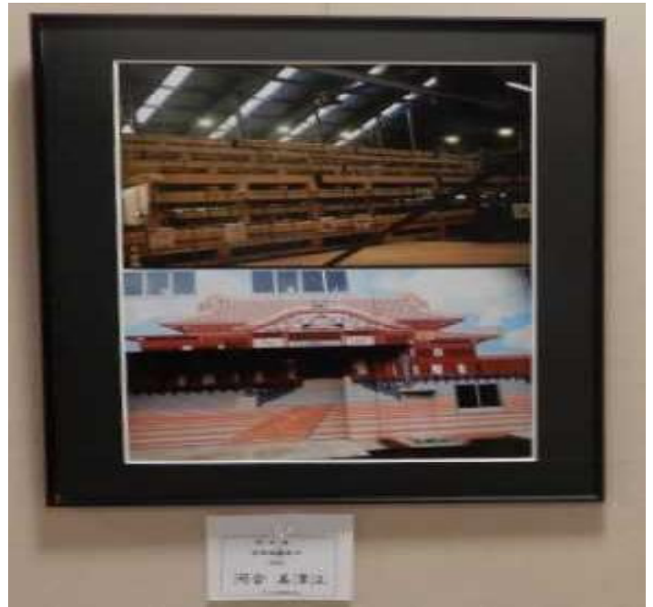
河合 美津江 1955年 10月